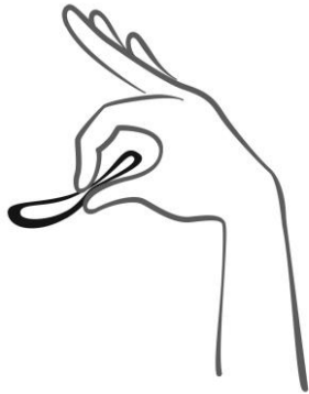
Rycina 2 Ścisnąć system